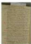
MuretPaleo6 Refus de mariage1.jpg

Pour la réunion du mardi 2 mars 2021, Denis Jacquet nous propose un texte du XVII ème siècle, montrant qu'en 1668 les femmes savaient déjà se défendre ! On travaillera plus sur les graphies de certaines lettres qui posent problème dans les Temps modernes : le R , le E , le S , lettres très courantes. Le texte est bien écrit, avec une écriture régulière et bien formée. Vous avez 3 fichiers Images (.jpg) à télécharger qui sont les suivant :