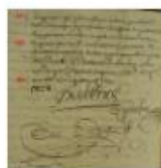
MuretPaleo6 Refus de mariage3.jpg