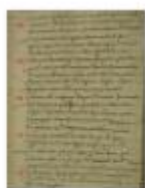
MuretPaleo6 Refus de mariage2.jpg